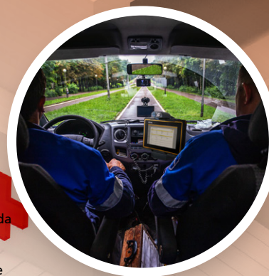
UX10-IP Getac Experiencia 3D