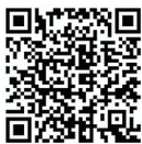
K120 3D demo